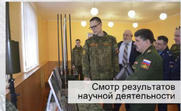
Смотр результатов научной деятельности