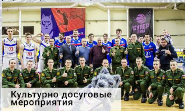
Культурно досуговые мероприятия

Культурно досуговые мероприятия операторов научной роты имеют широкую творческую программу. Военнослужащие участвуют в различных праздничных мероприятиях, в их числе: концерты, спартакиады, культпоходы. В свободное время у операторов есть возможность читать книги, играть в шахматы, ходить в спортзал, смотреть телевизор. В выходные дни для личного состава проводят показы кинофильмов в комнате досуга, экскурсии в музеи и на выставки, а также разрешены увольнения в город.