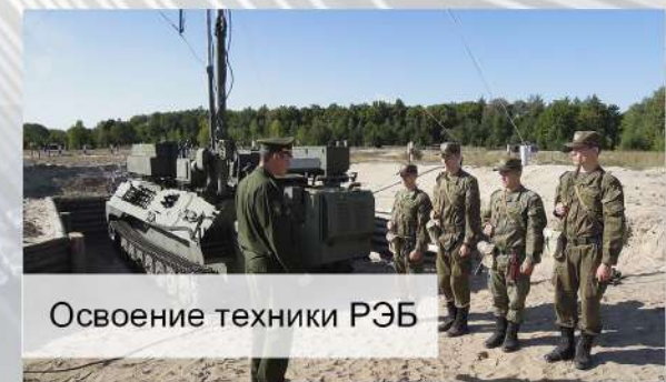
Освоение техники РЭБ