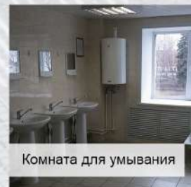
Комната для умывания