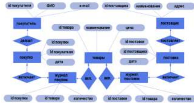
Рисунок 1 – Пример концептуальной модели предметной области «Продажи товаров»