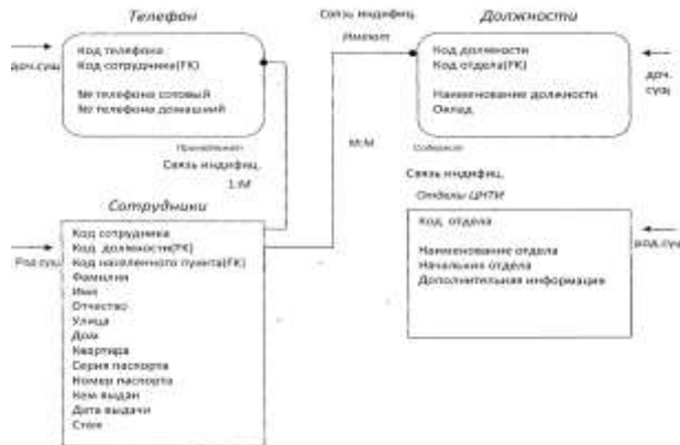
Рисунок 2 – Структура логической модели БД «Сотрудники»