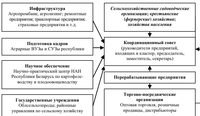
Рис. 3. Предлагаемая схема регионального садоводческого кластера (собственная разработка)

Главная цель создания – улучшение обеспечения плодовоовощной продукцией населения региона, снижение импорта, помощь личным подсобным хозяйствам в реализации продукции. Предлагается примерная схема создания регионального садоводческого кластера (кластер обычно сконцентрирован на территории одного региона), участниками которого являются организации всех форм собственности (рис. 3). Объединение предприятий в рамках кластерной структуры позволит многократно увеличить эффект охвата и минимизировать потери продукции плодовогодства, в частности в хозяйствах населения.