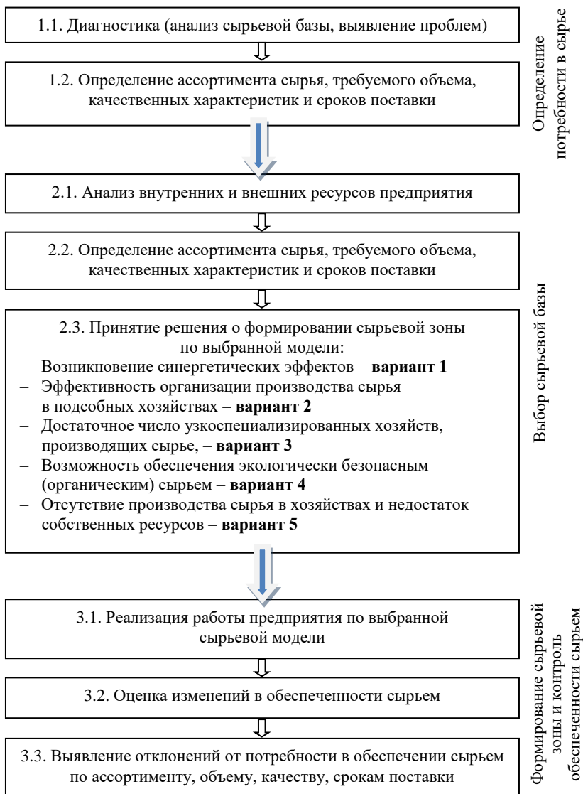
Рис. 5. Механизм формирования сырьевой зоны [38]

Данный механизм, затрагивая интересы как производителей сырья, так и его переработчиков, позволяет сформировать устойчивые партнерские связи между различными предприятиями, организациями, другими