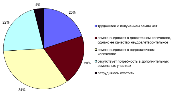
Рис. 1. Распределение ответов на вопрос «Испытывает ли Ваше К(Ф)Х трудности в получении земельных участков для ведения (расширения) сельскохозяйственного производства» (% к числу респондентов)

5. Низкий средний уровень фермерского землепользования. Значительная часть действующих К(Ф)Х хотела бы увеличить размеры обрабатываемой земли и, соответственно, обеспечить рост производства. Так, результаты конъюнктурного опроса руководителей фермерских хозяйств, проведенного НИЭИ в 2021 г., показали, что в 2020 г. проблемы с выделением дополнительных участков земли испытывали 34% респондентов, еще 20% заявляли о том, что предоставляемая земля имеет неудовлетворительное качество (рис. 1).